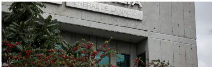
En las instalaciones de la Fiscalía se llevará a cabo la nueva indagación.

Roa, por su parte, ha señalado que fue con fondos propios como adquirió el apartamento, y que desconocía la titularidad de Princeton International Holding .