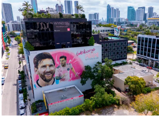
Lionel Messi convirtió al Inter Miami en uno de los proyectos deportivos más rentables de la región.

En solo dos años, Messi multiplicó por dos el valor del club, llevó a Apple TV a más de 11 millones de suscriptores, elevó los ingresos de la MLS y generó un crecimiento del 1.440% en redes. Su presencia también impulsó el turismo y agotó boletos en todo el país.