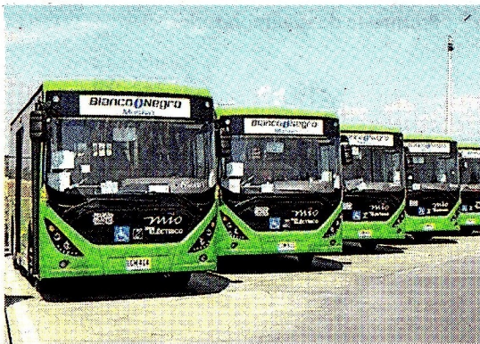
Alcaldía de Cali

Quedó en firme el decreto 1294 del 2 de diciembre, con el que el Ministerio de Comercio, Industria y Turismo , modificó parcialmente el Arancel de Aduanas para las importaciones de la subpartida arancelaria en la que se clasifican los buses eléctricos. En el decreto se modifica el arancel de 0% para la importación de buses eléctricos y se eleva a 10%, esto con el fin de impulsar el ensamble nacional de estos vehículos. (IS)