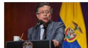
1. Presidente denuncia a sels