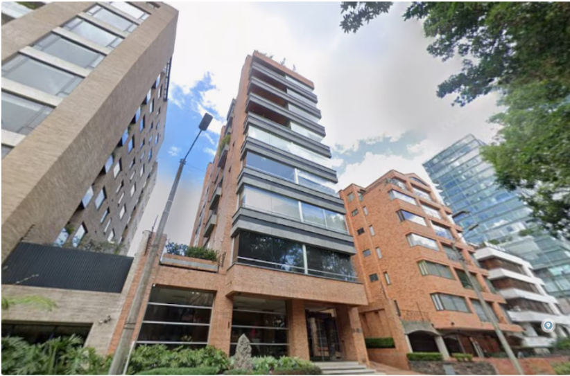
El apartamento estaría ubicado en este edificio, sobre la calle 92

Te puede interesar: En unos días las empresas tendrán que empezar a hacerle un pago extra a millones de trabajadores: la Reforma Laboral es la razón