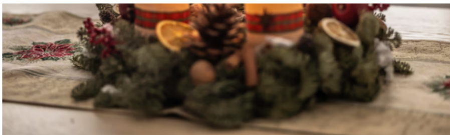
La industria de velas depende en gran medida del suministro de parafina, un insumo clave para esta temporada.

La capacidad nacional de producción bordea las 26.000 toneladas anuales, y cerca de la mitad se destina al consumo interno. El resto solía venderse a intermediarios, pero ahora se proyecta exportar directamente unas 800 toneladas mensuales bajo un esquema “door-to-port”, según la estrategia trazada por Ecopetrol para adentrarse de forma más competitiva en el mercado global .