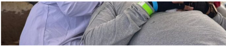
Profesionales de odontología brindan atención preventiva y curativa a niños y adultos en el marco de las brigadas de salud coordinadas con autoridades wayuu.

Las brigadas, desarrolladas en alianza con la Fundación GE (Gente Ecopetrol) , Grupo ANMCO , la Cruz Roja Colombiana y las secretarías de Salud de Maicao y Uribia, incluyeron consultas de medicina general, odontología —con servicios de profilaxis, resinas, extracciones y actividades de promoción y prevención— y valoración nutricional. Además, se entregaron 72 mil unidades de medicamentos y kits de salud oral.