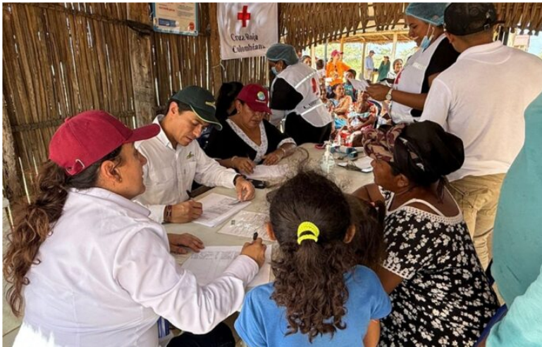
Equipo médico y autoridades wayuu registran a los asistentes durante las brigadas de salud realizadas en comunidades rurales de Maicao y Uribia.

En un ejercicio de articulación con las autoridades tradicionales y líderes comunitarios wayuu, Ecopetrol desarrolló un ciclo de 37 brigadas de salud que llevó atención médica a 28 comunidades rurales de Maicao y Uribia , beneficiando a 5 mil 36 personas , entre ellas 2 mil 482 niños y niñas .