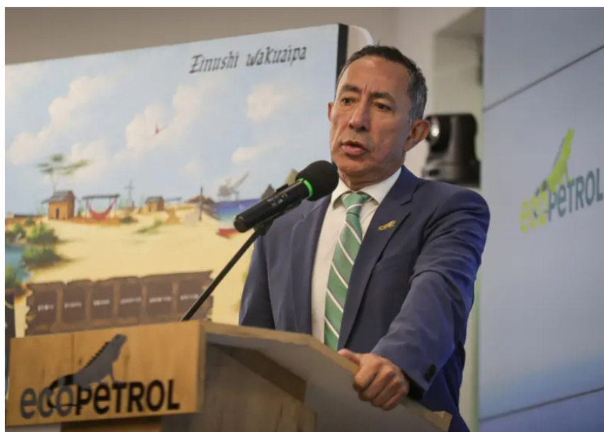
Presidente de Ecopetrol , Ricardo Roa citado por la Fiscalía.

El interrogatorio del próximo miércoles buscará aclarar si la operación obedeció a una transacción privada o si pudo haber incidido en futuros contratos dentro de la compañía.