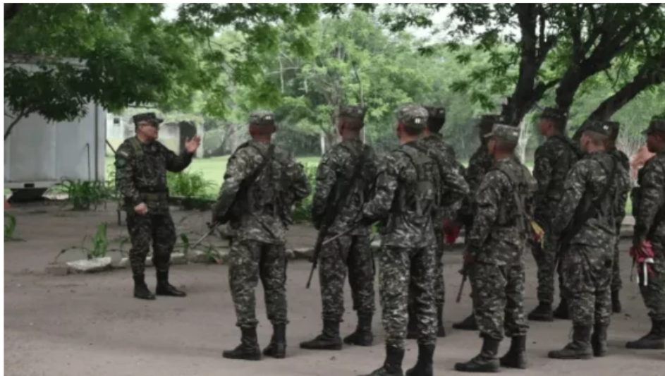
Exmilitares señalan al general Juan Miguel Huertas por falsos positivos en Antioquia ante la JEP