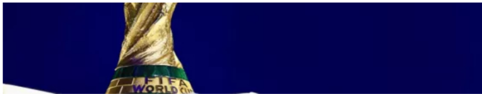
Mundial 2026: así quedaron los 12 grupos en Estados Unidos, México y Canadá tras el sorteo final