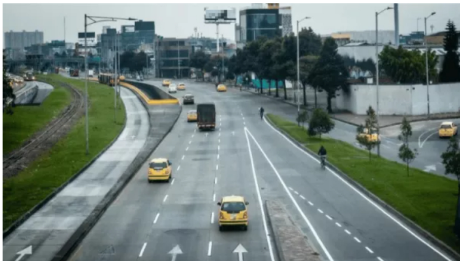
Bogotá levantará el pico y placa el 26 de diciembre y el 2 de enero por temporada navideña