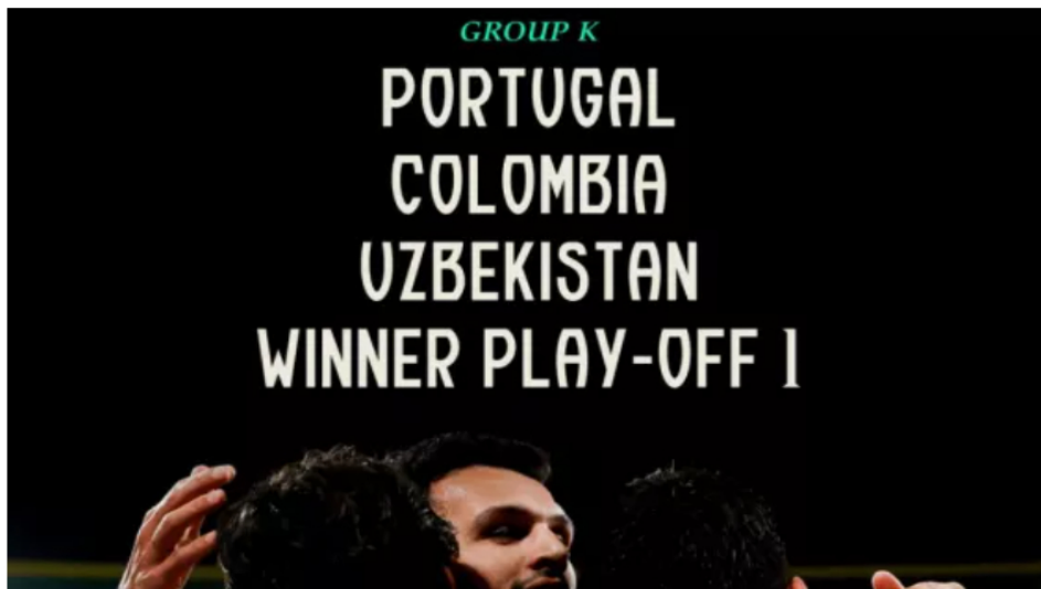
Grupo K del Mundial 2026: rivales de Colombia, calendario tentativo y análisis del sorteo en Estados Unidos