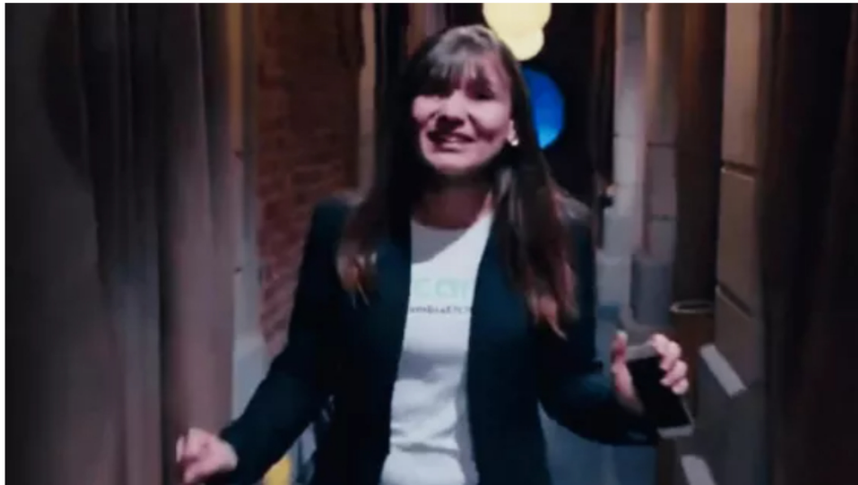
Detalles inéditos del envenenamiento: el móvil amoroso del caso Zulma Guzmán y el rastro del talio en Bogotá