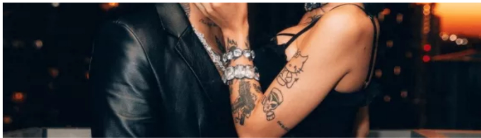
Christian Nodal demanda a Cazzu y afirma que entregó 12 millones de pesos para su hija