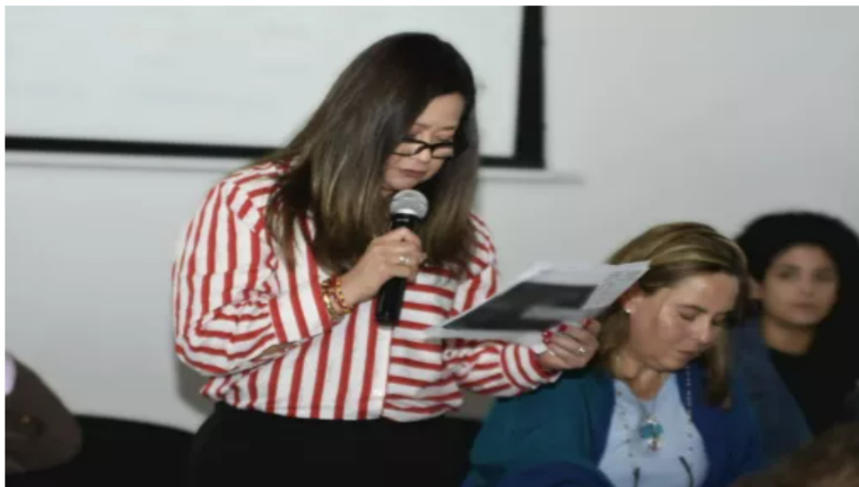
Gobierno denuncia "sabotaje tecnológico" en el espacio aéreo venezolano y pide pronunciamiento internacional