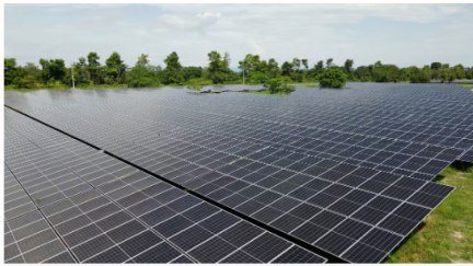
La Granja Solar La Iguana ocupa 26 hectáreas y abastecerá parte del consumo eléctrico de la Refinería de Barrancabermeja y de los campos Casabe y Llanito.