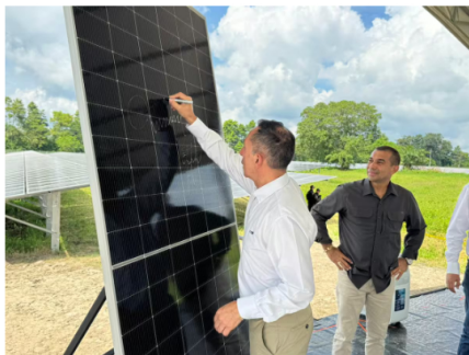
El presidente de Ecopetrol, Ricardo Roa Barragán, inauguró La Granja Solar La Iguana (Foto suministrada por Ecopetrol / VANGUARDIA).

El directivo añadió que la compañía proyecta un aumento significativo en su capacidad renovable en los próximos años. Para 2026, Ecopetrol espera dejar contratados cerca de 2.500 MW adicionales en proyectos solares y eólicos que se integrarán a sus operaciones.