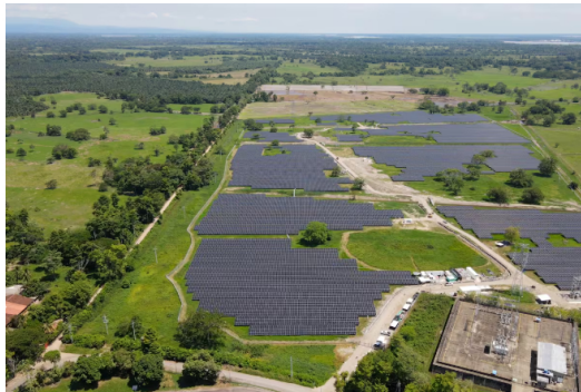
La Granja Solar La Iguana ocupa 26 hectáreas y abastecerá parte del consumo eléctrico de la Refinería de Barrancabermeja y de los campos Casabe y Llanito.

Siga las noticias de Vanguardia en Google Discover