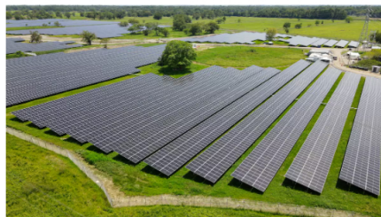
La Granja Solar La Iguana ocupa 26 hectáreas y abastecerá parte del consumo eléctrico de la Refinería de Barrancabermeja y de los campos Casabe y Llanito.

De acuerdo con la compañía, este proyecto evitará la emisión anual de unas 26.000 toneladas de CO2 y liberará 1.09 GBTUD de gas natural, recurso que hasta ahora se utilizaba para generación interna y que podrá ser redirigido a necesidades energéticas más estratégicas.