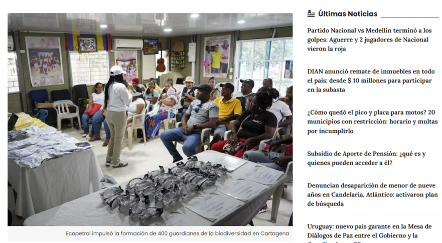
Ecopetrol impulsó la formación de 400 guardianes de la biodiversidad en Cartagena

En esta última fase de capacitación participaron 50 líderes del sector industrial de Mamonal