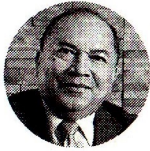
Amylkar Acosta Exministro de Minas y Energía

“No vamos a permitir que la especulación marque el rumbo del mercado del gas. Las decisiones las tomamos con datos oficiales y verificados con el Gestor del Mercado”.