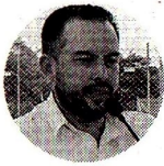
Edwin Palma Ministro de Minas y Energía

Amylkar Acosta, exministro de Minas y Energía, dijo que nueve qué medidas puede tomar Palma para aliviar a los usuarios. “El anuncio de Ecopetrol es para el año entrante y se hace en momentos en los que ya las empresas contrataron el gas por lo menos para los próximos tres meses. El alza, entre 20% y 30%, ya se viene aplicando desde comienzos de año al interior del país. La región Caribe no se había visto afectada porque las empresas que prestan el servicio ya tenían contratado el gas, pero esos contratos concluyeron en noviembre y, ahora, al firmar