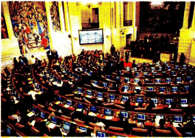
Este miércoles es definitivo para la reforma tributaria.