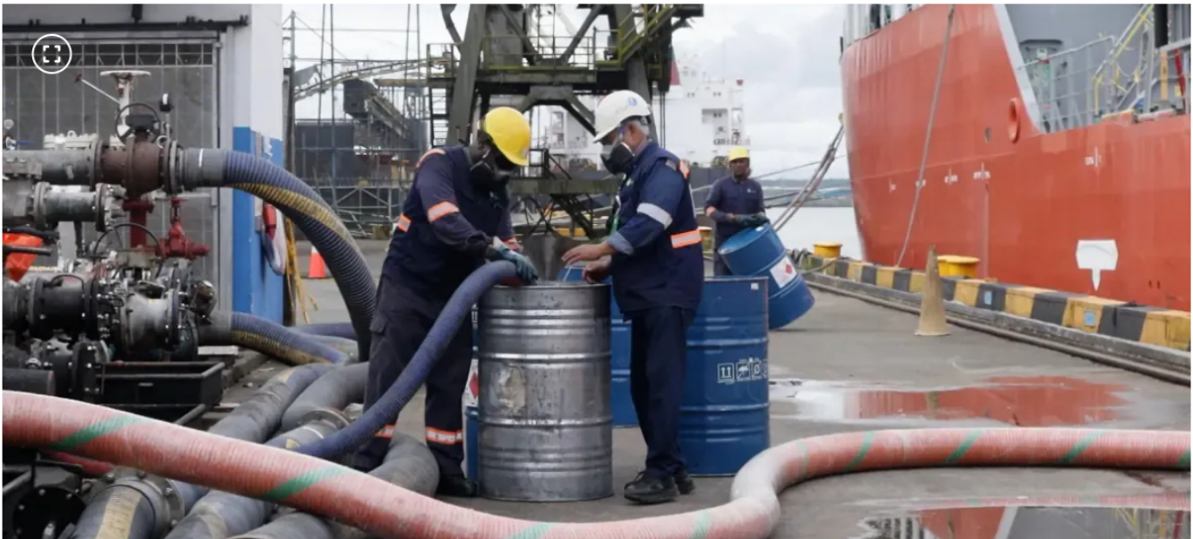
Exportación de petroquímicos desde el puerto de Buenaventura.

A partir de ahora, cada 45 días se exportarán desde este terminal cerca de 1.550 toneladas de producto.