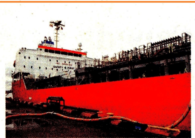
Exportación desde el puerto de Buenaventura.

Así mismo, el informe subraya que el gasto público, en particular, creció 14,2% anual, un ritmo que “ha contribuido a recalentar la economía” en los últimos meses y deja claro que “el auge de la demanda ha superado la capacidad productiva del país, impulsando las importaciones, en especial las de consumo, generando un deterioro del balance externo”.