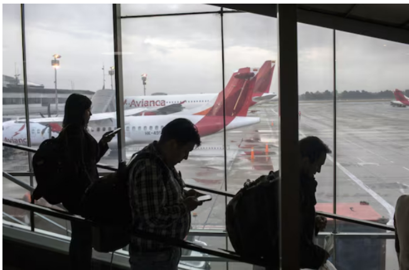
Qué soluciones dará Avianca para viajes desde Colombia hacia Venezuela