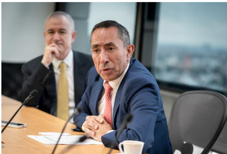
Las empresas que estrenarán CEO en 2026 en Colombia: Ecopetrol , Grupo Argos, Avianca