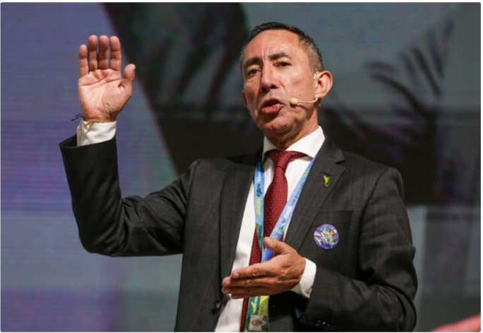
Ricardo Roa, presidente de Ecopetrol, ha tenido que sortear varios escándalos

Dichas cifras evidencian que la pérdida de valor de Ecopetrol ha sido considerablemente más pronunciada que la de sus pares internacionales.