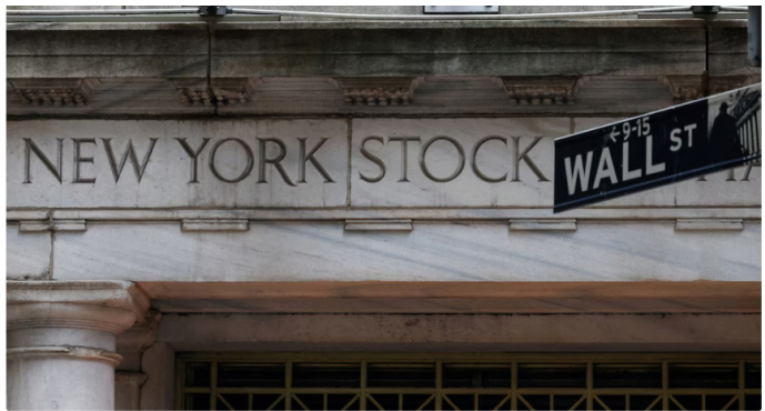
Wall Street es el símbolo de los mercados financieros de Estados Unidos y el centro mundial de finanzas

El comportamiento de Ecopetrol en Wall Street se diferencia de manera notable del de otras compañías del sector. Mientras la petrolera colombiana registró una disminución del 33,13% en el valor de su ADR, otras empresas mostraron signos positivos: