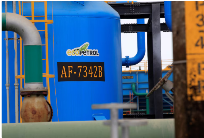
El Gobierno Petro informó en varias oportunidades que no firmarán nuevos contratos de exploración o explotación de petróleo y gas