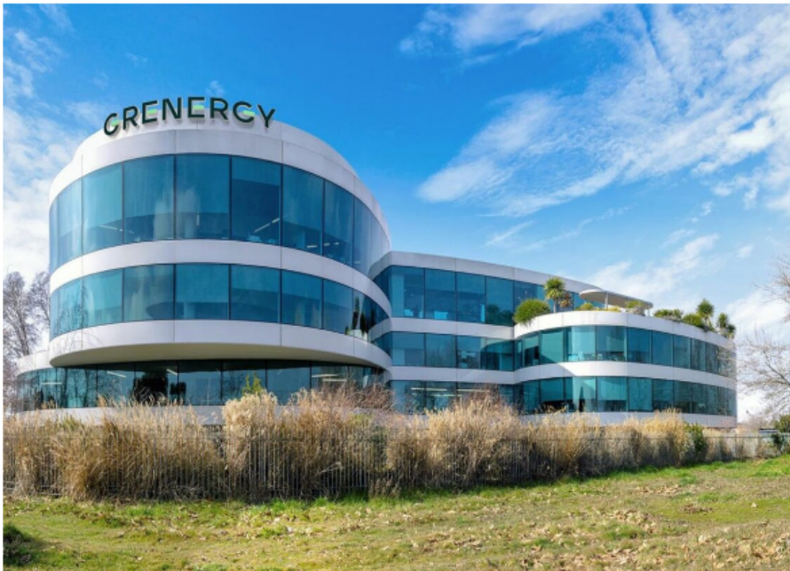
Archivo - Oficinas GrenergyGREENERGY - Archivo

Grenergy ha formalizado un acuerdo con Ecopetrol, la empresa petrolera de Colombia, para transferir la propiedad de siete instalaciones fotovoltaicas distribuidas por el país, que juntas suman una potencia de 88 megavatios (MW). Estas instalaciones serán entregadas de forma progresiva e independiente a lo largo de 2026, como se detalla en una nota de prensa de la empresa.