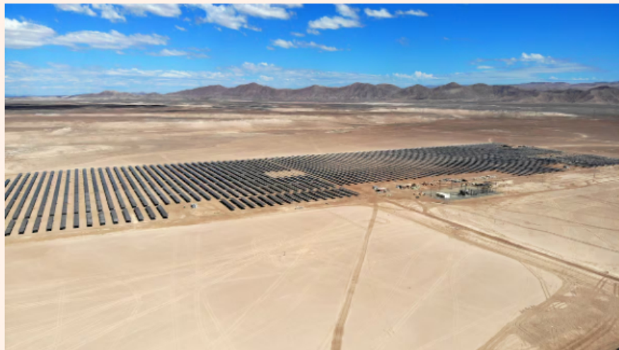
El proyecto Quillagua-Oasis de Atacama de Grenergy.

La compañía entregará los parques, con una capacidad instalada total de 88 megavatios (MW), de manera escalonada e independiente a lo largo de 2026