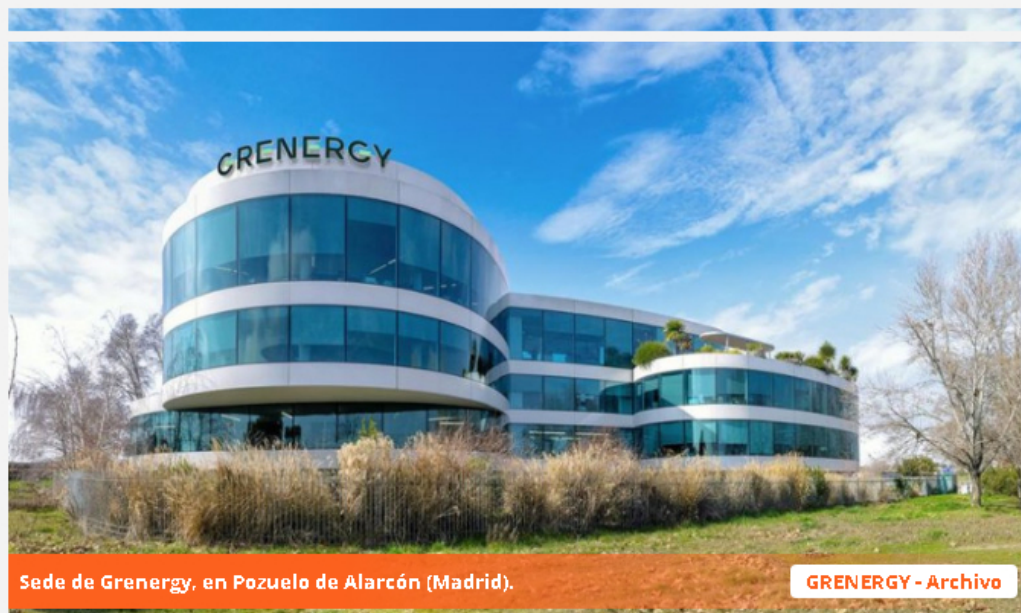
Sede de Greenergy, en Pozuelo de Alarcón (Madrid).