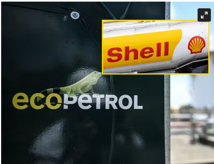
Ecopetrol y Shell imágenes de referencia.

Las dos compañías estudian alternativas para que Ecopetrol siga con la exploración de los yacimientos de gas