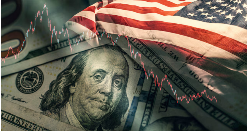
El mercado financiero en Estados Unidos se sacude fuertemente durante estos días por la guerra de aranceles de Trump.

Mineros es una de las acciones que más pierde valor en el mercado bursátil colombiano, pues tiene una baja de 5,42 %, seguida por la acción de Concreto, que registra una baja del 5,11 %.