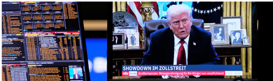
Las acciones se desploman este viernes en todo el mundo. La decisión de Trump tiene fuertes impactos en la economía mundial.

Fiscalía: un juez avala el principio de oportunidad