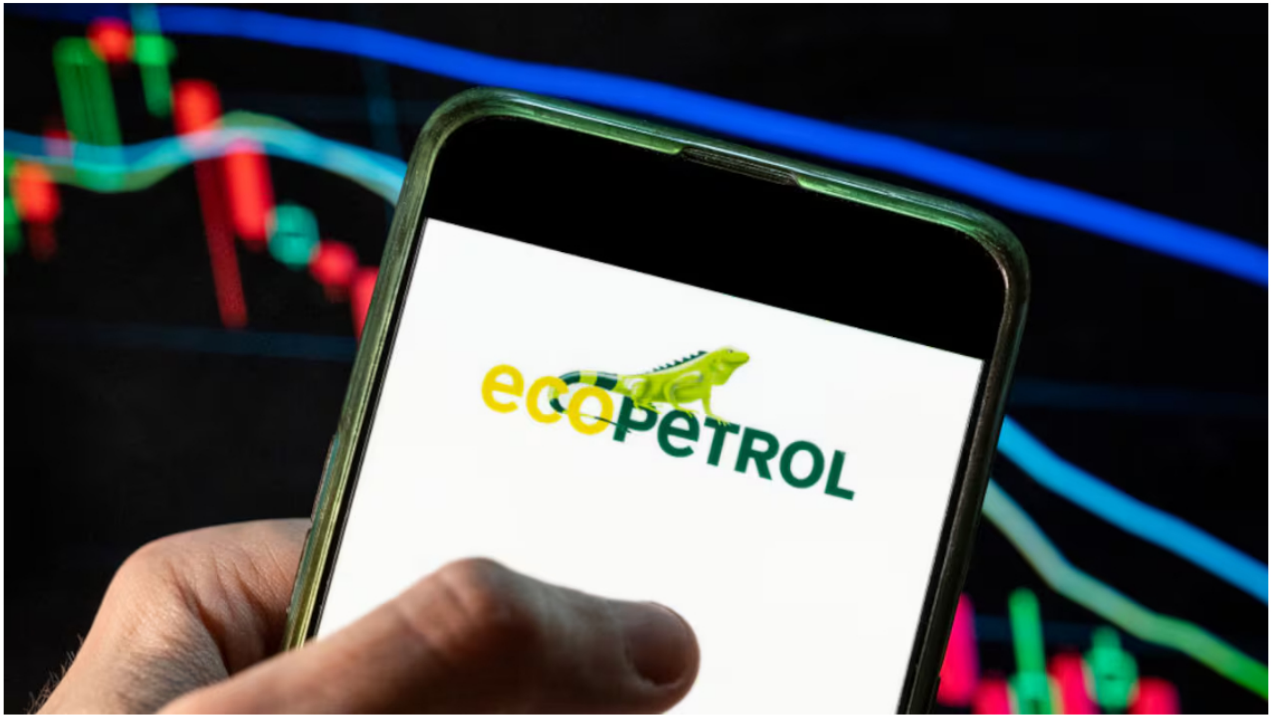
Cae hoy fuertemente la acción de Ecopetrol .

Este 4 de abril, los mercados mundiales se han cubierto de un rojo intenso tras la decisión de Donald Trump de imponer aranceles que él llama recíprocos a cerca de 50 países en todo el mundo, lo que ha afectado cientos de mercados bursátiles, por las afectaciones a empresas y gigantes del retail y la tecnología, entre otros.