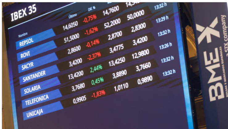
Archivo - Un panel del Ibx 35 en el Palacio de la Bolsa, a 6 de septiembre de 2023, en Madrid (España). El Ibx 35 registraba una caída el 0,62% hacia la media sesión, ahondando en el descenso que ya había registrado en la apertura y situándose en

El mercado colombiano abrió con fuertes pérdidas este viernes, arrastrado por la caída del petróleo y la incertidumbre global generada por los nuevos aranceles impuestos por Estados Unidos.