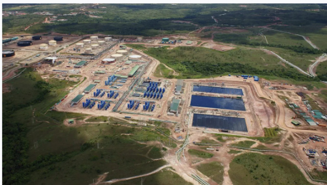
Petróleo, Colombia.

Forbes Staff | abril 4, 2025 @ 7:44:07 am