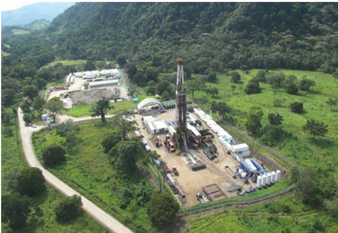
La empresa no especificó cuáles fueron los compromisos adquiridos.

" Ecopetrol reitera su compromiso con el diálogo como herramienta fundamental para la construcción de soluciones hace un llamado a todos los actores sociales a continuar trabajando conjuntamente por el bienestar y desarrollo integral del municipio de Puerto Gaitán ", dijo la empresa.