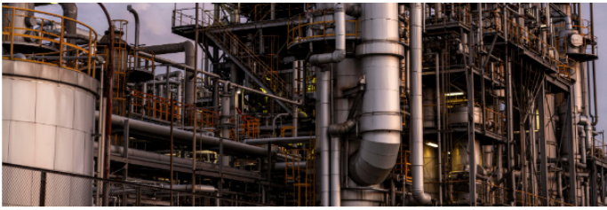
Los bloqueos detuvieron la producción, el mantenimiento y el transporte de hidrocarburos.

En la mesa participaron representantes de la comunidad indígena, el Ministerio del Interior, la Agencia Nacional de Hidrocarburos, la Defensoría del Pueblo y la Gobernación del Meta, entre otras instituciones.