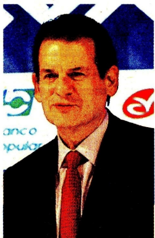
Luis C. Sarmiento G., presidente de la junta de Grupo Aval.

En la reciente temporada de reuniones ordinarias de socios de las principales firmas que cotizan en Bolsa, los presidentes de estas compañías también dejaron ver sus inquietudes sobre el nivel del crecimiento, la inversión, las políticas públicas y los desafíos que enfrentan los negocios. Págs. 4-5