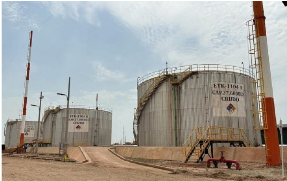
Instalaciones de Ecopetrol en el campo Caño Sur.