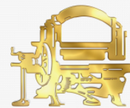
Columna Digital HD Logo

Grupo Editorial Guáaaaaa / Fundado en 1988.