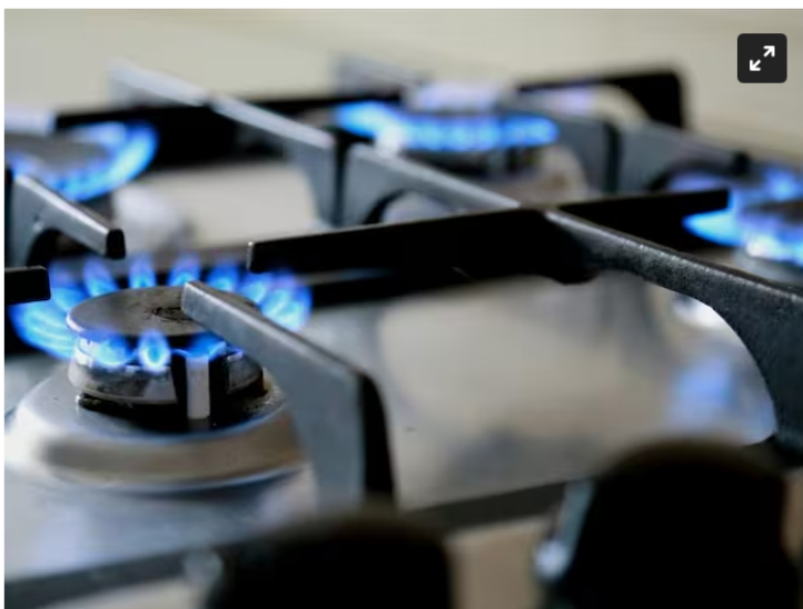
Denuncian que las tarifas del gas en Bogotá se triplicaron durante el confinamiento.

Se hace un llamado a Ecopetrol , la CREG y la UPME para abaratar los costos de gas y se recupere la confiabilidad del suministro.