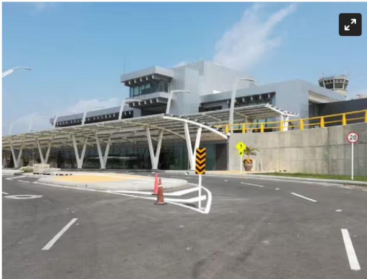
Aeropuerto Ernesto Cortissoz.

LATAM operará más de 700 vuelos con los 32 mil barriles de Jet A1.