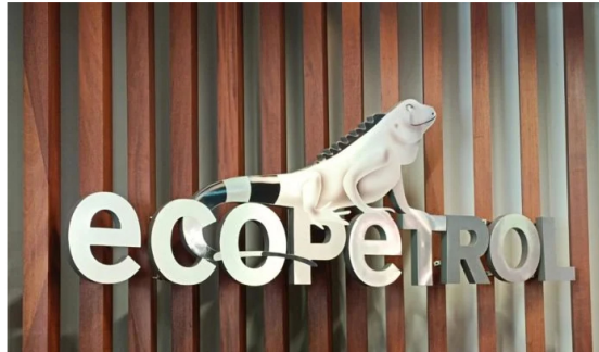
No es cierto que Ecopetrol haya cerrado operación de Campo Rubiales por bloqueos.