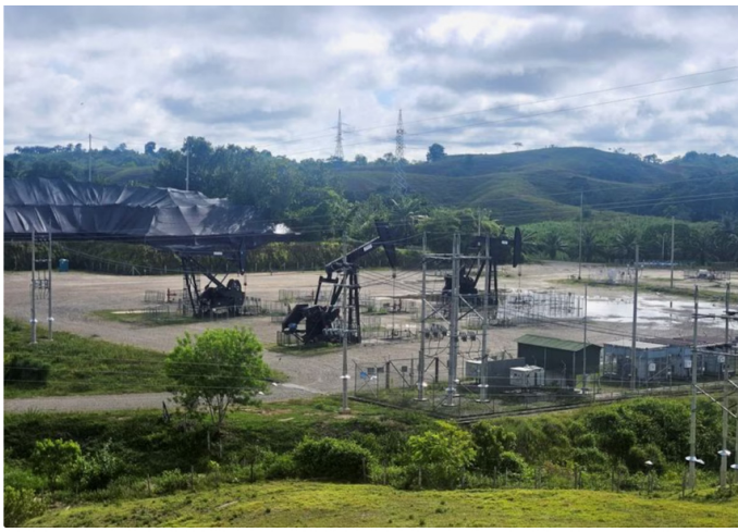
Ecopetrol reportó una reducción de 2,25 millones de toneladas de dióxido de carbono equivalente (CO 2 e) entre 2020 y 2024

En febrero de 2025, Ecopetrol obtuvo la Declaración de Verificación de su Inventario de Emisiones de Gases de Efecto Invernadero (GEI) correspondiente al periodo 2021-2023. Esta verificación fue realizada por un tercero independiente bajo la norma ISO 14063, en cumplimiento del estándar GHG Protocol, con un nivel de aseguramiento limitado.