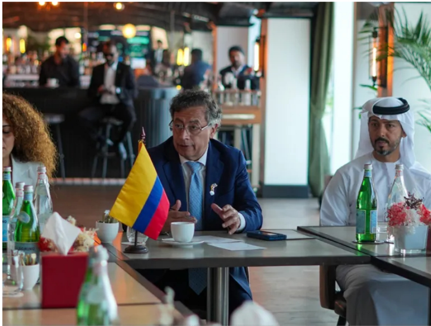
El presidente Gustavo Petro en Emiratos Árabes

El presidente Petro afirmó el fin de semana que el grupo Ecopetrol construirá, junto a Emiratos Árabes, una "infraestructura de inteligencia artificial" cerca a Santa Marta para crear una "nube soberana con los datos del país".