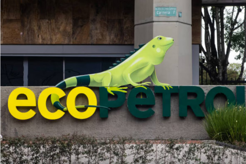
Ecopetrol es la principal empresa del Estado colombiano y la que genera más dividendos al país

Y es que para esta, de acuerdo con un comunicado difundido, la finalización del contrato "fue un acto abiertamente ilegal que vulneró el debido proceso y los principios de la función administrativa". La compañía sostiene que cumplió con todas las exigencias estipuladas tanto en las condiciones del pliego como en el documento contractual.