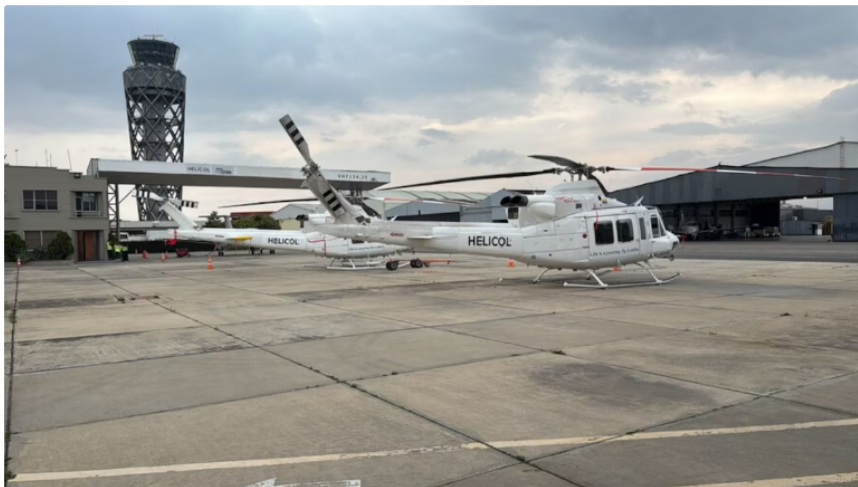
Helicópteros, licencias personales y certificaciones generaron dudas sobre la capacidad operativa de helicol para cumplir con los estándares contractuales

Helicol es una empresa colombiana que opera helicópteros y aviones, y ofrece servicios de mantenimiento, entrenamiento y alquiler. La misma tiene un conflicto desde hace un tiempo con Ecopetrol y ya escaló en el ámbito judicial, luego de que la estatal petrolera decidió terminar de manera anticipada el contrato suscrito con la compañía para el suministro de transporte aéreo en helicópteros.