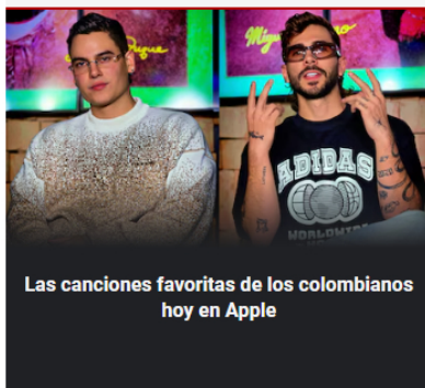
Las canciones favoritas de los colombianos hoy en Apple