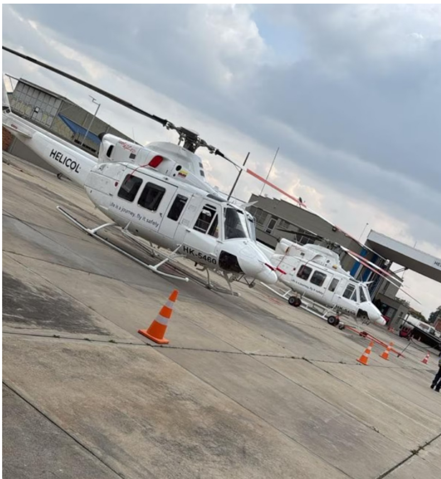
Helicol sostiene que la terminación del contrato fue ilegal

Además, surgieron dudas sobre la experiencia y documentación del personal aeronáutico. Ecopetrol señaló que “no se evidencia, dentro de la certificación de horas voladas para las tripulaciones, los equipos o aeronaves en las cuales se registraron esas horas”. A esto se sumó que el despachador presentado por Helicol tenía su licencia de la Aeronáutica Civil (Aerocivil) suspendida y no se entregaron certificaciones de 21 cursos aeronáuticos exigidos en las especificaciones técnicas.