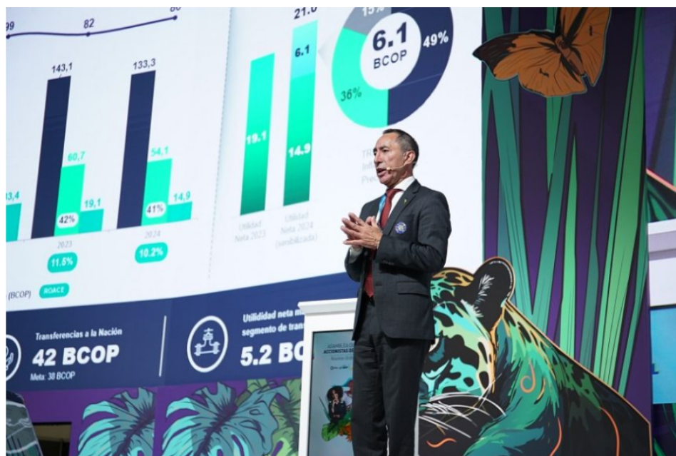
Presidente del Grupo Ecopetrol, Ricardo Roa Barragán, ante la asamblea general de accionistas que sesionó en Bogotá.

Compartir [Facebook] [Twitter] [Email] [Print] [More]