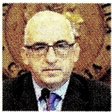
LEONARDO VILLAR GERENTE BANCO DE LA REPÚBLICA

La Junta Directiva del Banco de la República se reunirá hoy para revisar las tasas. En este encuentro, en cabeza del gerente general, Leonardo Villar , se tiene previsto que decidan hacer un recorte de tasas de interés.