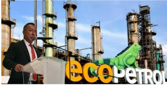
El director de la petrolera asegura que se debe empezar a importar gas para el año entrante.

El presidente de Ecopetrol, Ricardo Roa, confirmó que hay faltantes en la reserva del gas y su precio podría subir a partir de 2025.