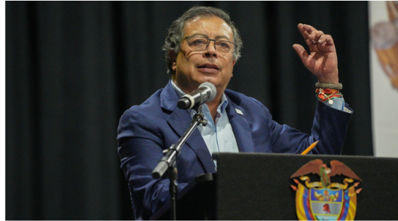
La tutela fue interpuesta entre otros por parte de la Fundación Para la Libertad de Prensa. Presidencia de Colombia

Publicado: Viernes, Septiembre 27, 2024 - 10:12 | Actualizado: Viernes, Septiembre 27, 2024 - 10:13