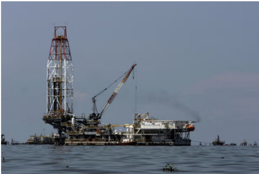
Esta decisión se suma a la que tomó MinMinas de impugnar la suspensión judicial.

Además, por temas culturales, la decisión judicial también ordenó a Ecopetrol y Petrobras que se abstengan de utilizar nombres o símbolos culturales de la comunidad Taganga o de otros pueblos indígenas, para identificar sus proyectos, sin el debido consentimiento de dichas comunidades.