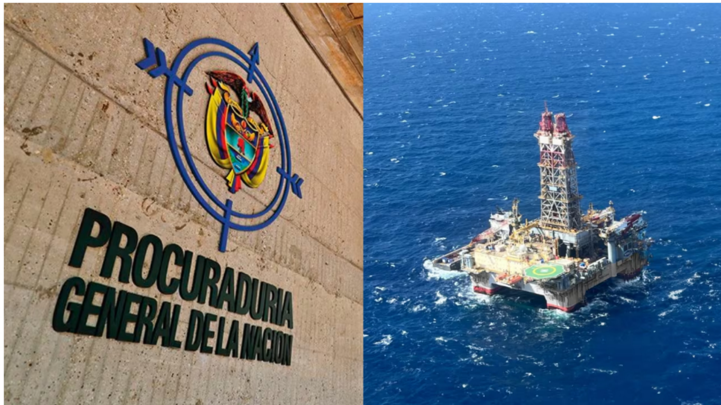
La Procuraduría también solicitó que se le dé una orden a la Anla para que esté al frente de la situación.

La Procuraduría General de la Nación en las últimas horas solicitó anular el fallo de tutela de un juez del distrito judicial de Santa Marta, que ordenó la paralización de exploración de gas que venía adelantando Ecopetrol y Petrobras en el pozo Uchuva 2.