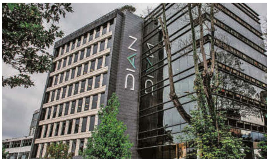
Por las metas desfasadas que se plantearon en el año pasado, la Dian no logrará cumplir con el objetivo de recaudo en 2024.