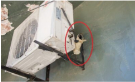
Intensificarán controles por robos de tuberías de aires acondicionados en Barrancabermeja