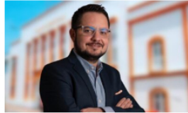
La Alcaldía de Barrancabermeja crea el cargo de gerente Distrital