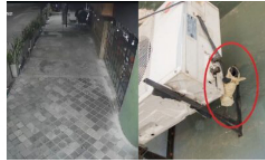
Ladrones de techos continúan afectando restaurantes en Barrancabermeja