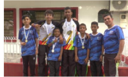
Deportistas de Barrancabermeja destacan en campeonato nacional de canotaje