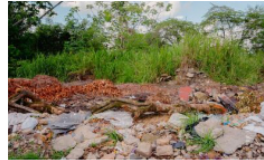
Inicia jornada de recuperación de espacio público en el sector El Tiburón