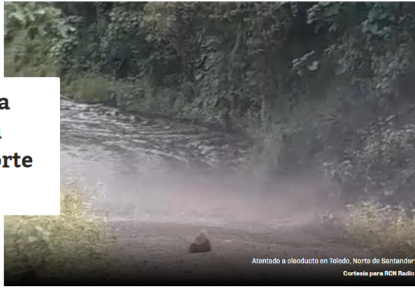
Atentado a oleoducto en Toledo, Norte de Santander