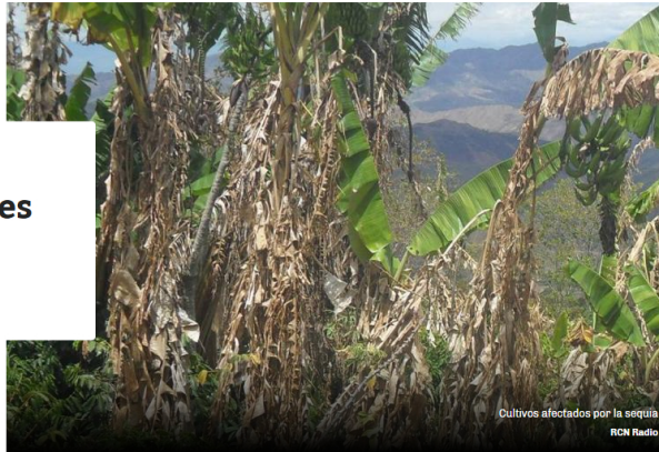
Cultivos afectados por la sequía