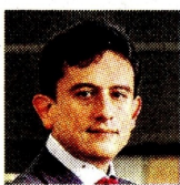
LUIS CARLOS REYES MINISTRO DE COMERCIO

Desde el Ejecutivo se está apostando por destinos turísticos no tradicionales, especialmente en los departamentos del Pacífico y La Guajira. Por ello, el Mincomercio trabaja con las instituciones para la seguridad turística en los territorios.