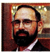
ANDRÉS CAMACHO MINISTRO DE MINAS Y ENERGÍA

Ecopetrol suspendió el suministro de gas natural a un grupo de empresas comercializadoras del combustible a vehículos, para destinarlo a la generación de energía eléctrica a través de plantas térmicas, debido a la intensa sequía.