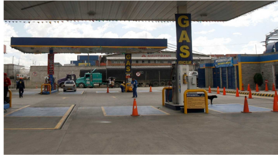
Estación de gas vehicular Colprensa

Publicado: Viernes, Septiembre 20, 2024 - 19:24 | Actualizado: Viernes, Septiembre 20, 2024 - 19:24