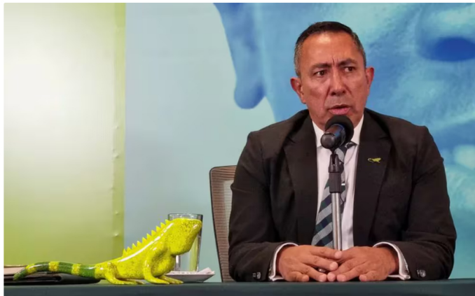
El presidente de Ecopetrol, Ricardo Roa, aseguró que es muy probable que haya un aumento en el precio del gas

Ecopetrol anunció la suspensión temporal de la venta de gas vehicular a 13 empresas distribuidoras en Colombia, con el objetivo de priorizar la generación de energía para plantas termoeléctricas. Esta medida se tomó debido a la crisis de sequía y los bajos niveles en los embalses del país, lo que ha obligado a la compañía a redirigir el uso del gas para asegurar el suministro energético.