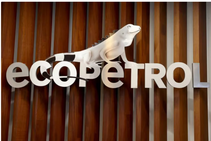
Ecopetrol asegura que se vio obligada a tomar esa decisión por la reducción de agua en los embalses

Además, sobre un posible aumento en el precio del gas, Roa puntualizó: " Yo sí creo que esa es una realidad que hay que ir teniendo presente , con referencia a los últimos meses y años se han presentado exportaciones de gas en cantidades muy grandes, ese activo mediante el cual se ha hecho esto, gas va a seguir habiendo, pero cuando se compra el gas licuado vamos a tener un precio distinto si estuviéramos entregando el gas desde nuestros pozos".