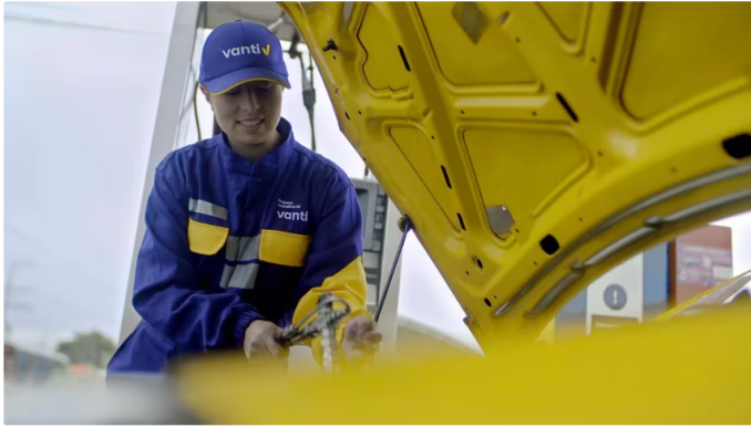
El objetivo es garantizar el suministro para todos los que lo requieran

Los distribuidores de gas mayoristas cuentan con contratos que les permiten ajustar la demanda en situaciones críticas. Por ejemplo, si el precio del gas se acerca al 95% de escasez, se activa un mecanismo para redistribuir la demanda de manera más equitativa. Este tipo de medidas son esenciales para mantener el equilibrio en el suministro de gas y evitar interrupciones que podrían tener consecuencias graves para diversos sectores económicos.