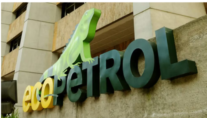
Fachada de Ecopetrol en Bogotá

Ecopetrol ha anunciado la suspensión temporal del suministro de gas vehicular a 13 empresas distribuidoras debido a una contingencia derivada de la escasez de lluvias, lo cual ha incrementado la necesidad de generación eléctrica a través de termoeléctricas, que utilizan gas como fuente de energía, de acuerdo con información obtenida por la emisora colombiana Blu Radio .