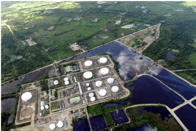
Las termoeléctricas son una forma de generar energía a partir del gas

Ahora puede seguirnos en Facebook y en nuestro WhatsApp Channel .