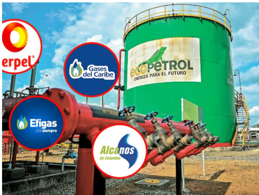
Ecopetrol suspende temporalmente venta de gas vehicular a 13 empresas.

Entre las distribuidoras se destaca Terpel, y todo por la decisión de la empresa estatal por enfocarse en la generación de energía para plantas termoeléctricas en el país.