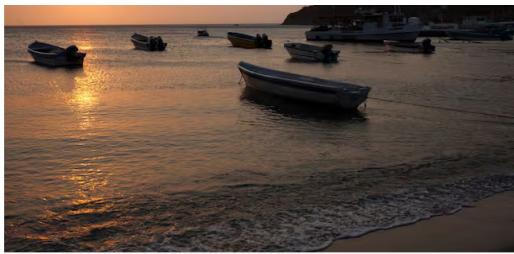
Playa de Taganga en Santa Marta.