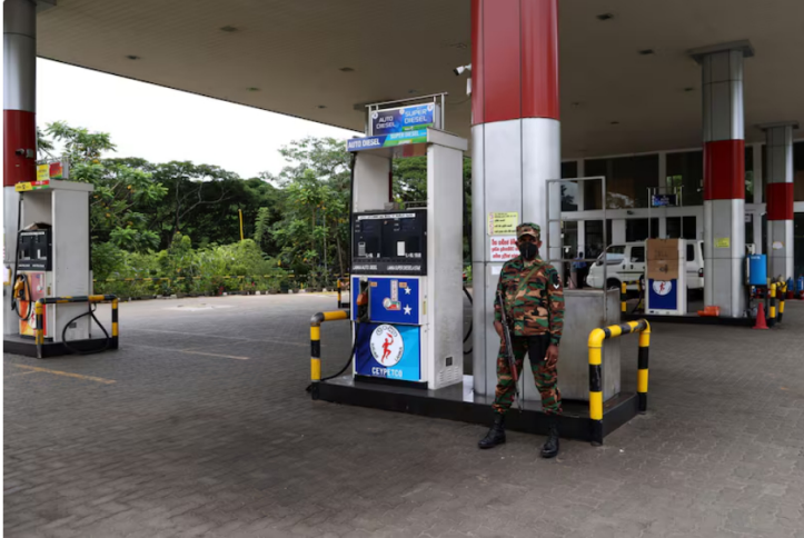
Economy Grinds to Halt as Fuel Supplies Run Dry in Sri Lanka A soldier guards a fuel pump after a gas station ran out of gasoline in Kandy, Sri Lanka, on Friday, June 17, 2022. The government of Sri Lanka declared Friday a holiday for public offices and schools to curtail vehicular movement as the country, facing its worst financial crisis, runs out of fuel for transport and there's little signs of fresh supplies coming in.

La decisión responde al descenso sostenido que vienen presentando los embalses en el país. Explicó que la medida aplica solo para algunas empresas que tenían contratos sin seguro o protección especial