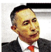
RICARDO ROA BARRAGÁN PRESIDENTE DE ECOPETROL

Tras el fallo que ordenó el cese a las operaciones en Uchuva 2, Ricardo Roa aseguró que impugnaran el fallo para reactivar las operaciones ya que, el proyecto es importante para la seguridad energética asegurando que se ha desarrollado de forma segura.