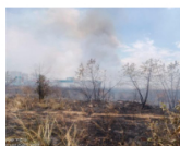
18 septiembre, 2024 Bomberos de Neiva controlan incendio forestal en el oriente de la ciudad