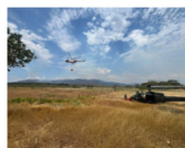
18 septiembre, 2024 En este momento incendios forestales afectan a 18 municipios en Colombia