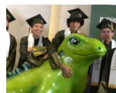
18 septiembre, 2024 100 jóvenes de 75 municipios recibieron la beca bachilleres Ecopetrol